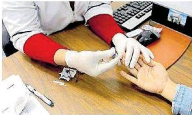
La prueba es confidencial y voluntaria, en los centros de Salud de la ciudad, el valle y San Felipe.

Los pacientes con diagnóstico de VIH son quienes portan el virus y los referidos con SIDA son aquellos que han desarrollado las manifestaciones de éste.